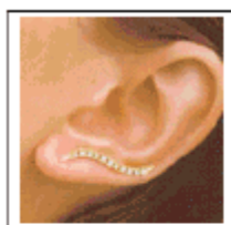
Äther (Ohren) Vata